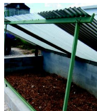
Aire de lavage et lit biologique